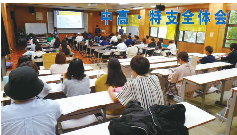
中高・特支全体会