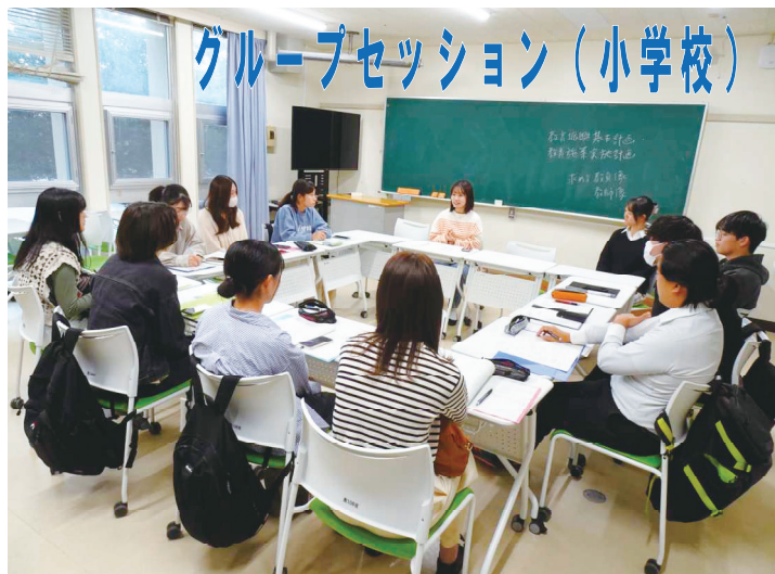
グループセッション (小学校)