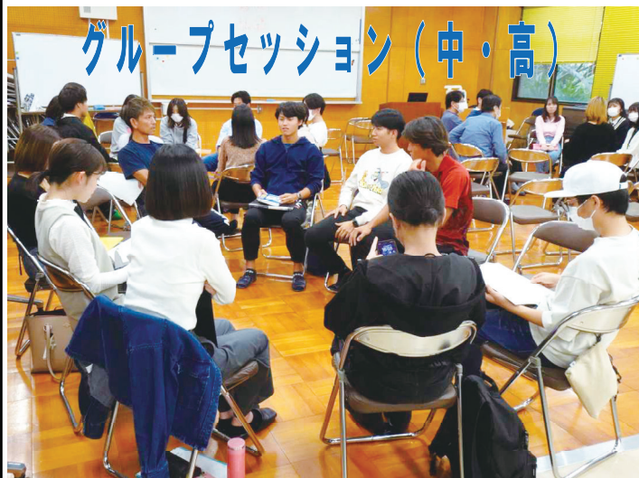
グループセッション (中・高)