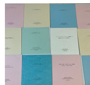
これまでの卒業論文の一部